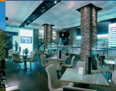
Meeting in riva al mare Meeting at the seaside