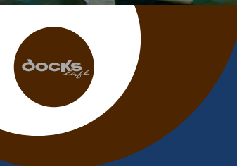
il Docks Café, punto d'incontro per piccoli brunch e aperitivi Docks Café, meeting point for brunch and happy hour