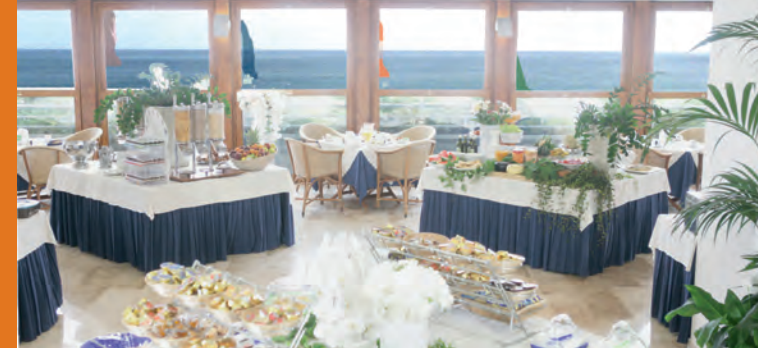
la sala Colazioni Breakfast Lounge